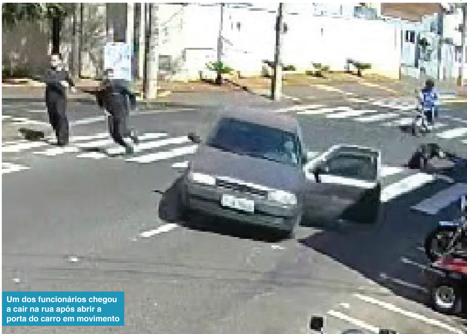
Um dos funcionários chegou a cair na rua após abrir a porta do carro em movimento